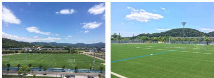
人工芝グラウンド(概要)